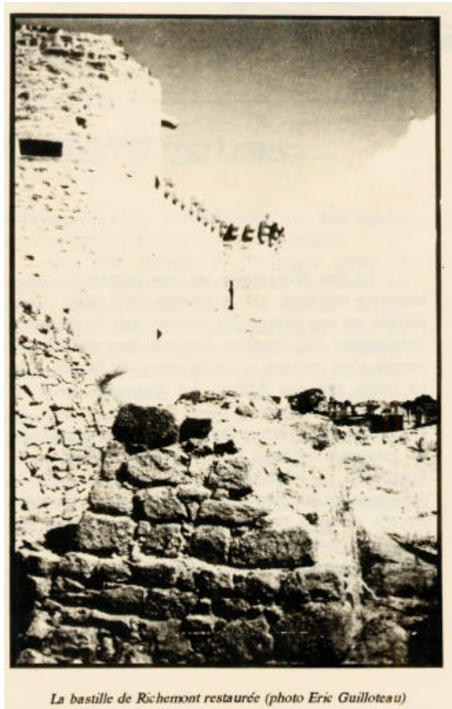
La bastille de Richemont restaurée