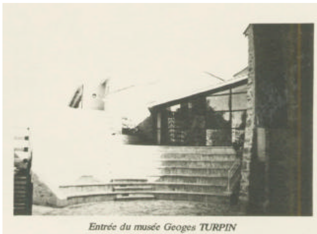
Entrée du musée Georges TURPIN